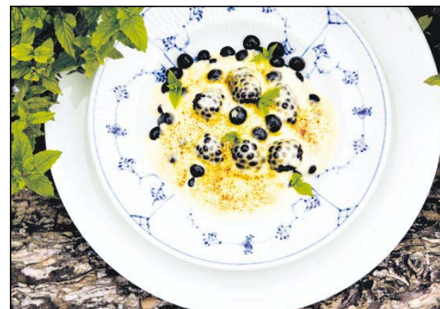
Bær i Sabayonne.