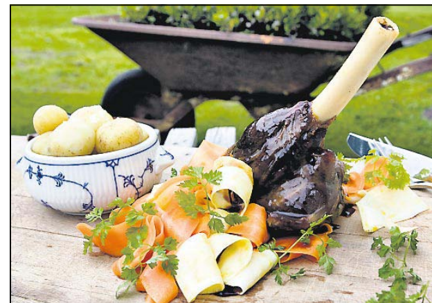
Braiseret lammeskank.

Blommer og sukker piskes hvidt, let og luftigt - Tilsæt derefter væsken og legeres til cremekonsistens over svag varme - Sauce er klar til at hælde over bærrene.